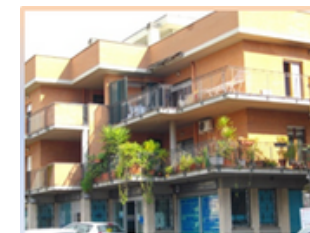
Struttura Villa Adriana

Il trattamento è a totale carico del Servizio Sanitario Regionale