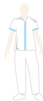
ADDETTO ALLE PULIZIE