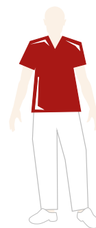
LOGOPEDISTA E FISIOTERAPISTA