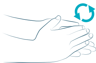
1 palmo su palmo