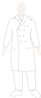
DIRETTORE SANITARIO E MEDICI

Presso la Casa di Cura Monte Imperatore la funzione di ogni professionista all'interno dello staff è identificabile grazie all'utilizzo di uniformi di diverso colore, oltre che dall'apposito cartellino di riconoscimento e qualificazione che è ben visibile.