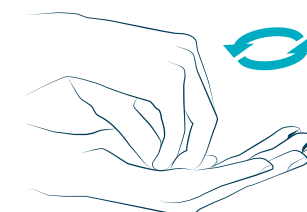
6 con le dita chiuse sul palmo