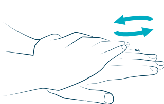
2 palmo sopra il dorso